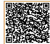
QR-Code zum Video

Erfahren Sie mehr zur Dosierung und Dosisanpassung auf der nächsten Seite oder in unserem Erklärvideo.